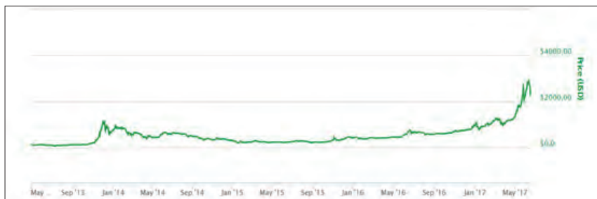
圖、比特幣兌美元報價走勢圖