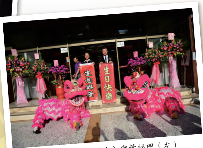
▲ 豐興鋼鐵林董事長（右）與葉經理（左）