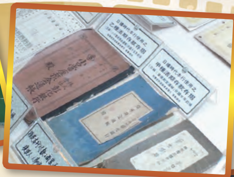
▲ 甲種及乙種活期存款存根