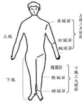
(2)上、下肢關節生理運動範圍一覽表