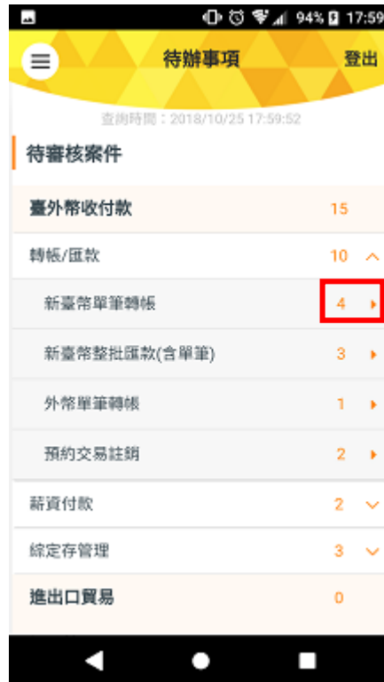
點選欲審核之交易