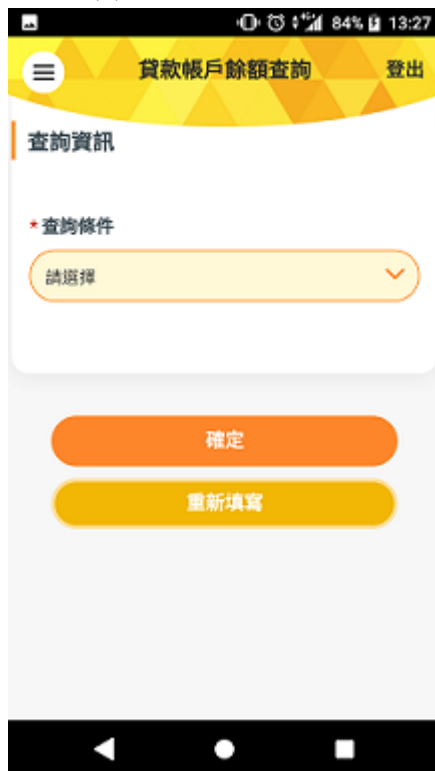
(1)貸款帳戶餘額查詢