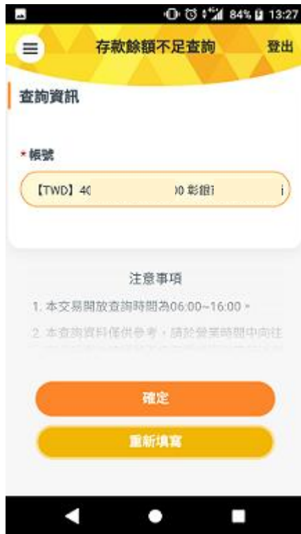
(3)存款餘額不足查詢