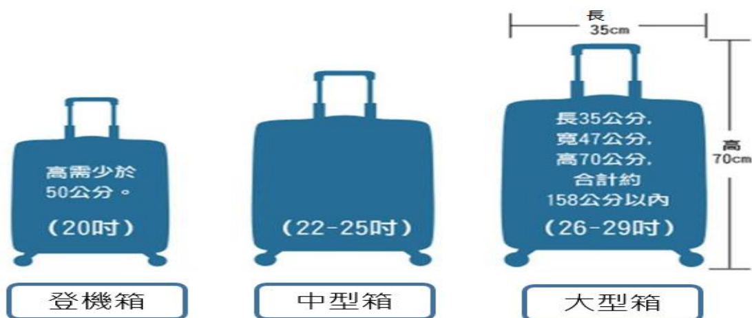
機場接送服務收費標準表-卡友優惠價