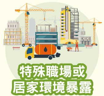
特殊職場或居家環境暴露