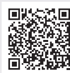
新光人壽宣告利率查詢