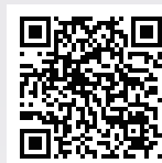
了解保戶回饋活動