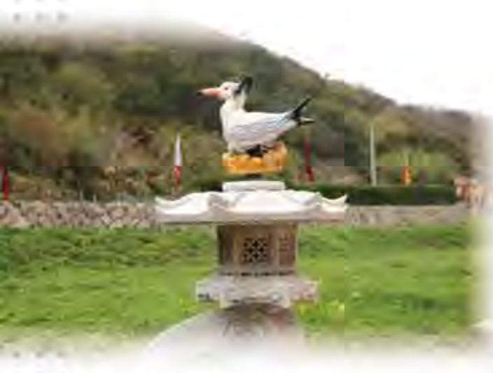
▲坂里海灘的神話之鳥路燈

來到塘崎—北竿鄉公所所在地，緊鄰機場，商業氣息濃厚。看到許多跑者從鄉公所走出來，我趕緊進入二樓領取路跑物資，包括T恤、毛巾、頭巾、帽T、號碼牌及黏在號碼牌背面的拋棄式計時晶片。