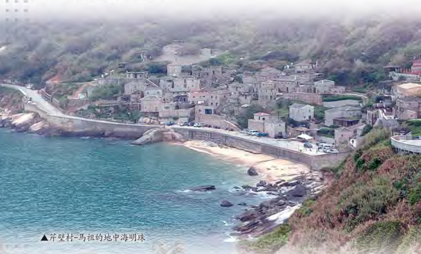
▲芹壁村-馬祖的地中海明珠

回到南竿又去前天光顧的餐館用餐，這次老闆娘特別推薦酥炸紅糟海鰻，肉質鮮美，有嚼勁，只是刺很多，年輕人比較不喜歡，而且沒吃完也可以當宵夜，像吃鹽酥雞一般美味。果然好吃，份量又多，帶回去當明日早餐。下雨天的晚上，街道冷冷清清，進入紀念品店買了小黃魚干、魷魚干及馬祖陳高與老酒。一夜雨滴聲不斷，希望明天機場正常起飛。隔日起床先上網查看能見度超過4,000公尺，機場運作正常，我和老婆到港口邊的85度C從容悠閒的享受咖啡與麵包，最後的馬祖巡禮即將結束。來到機場，人山人海，候補櫃檯擠滿心急的旅客，幸運的我劃了位，帶著心滿意足的心情，搭上飛機返台。在飛機上我思索著，下次還要參加嗎？