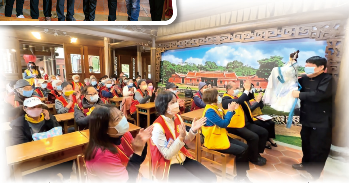
▲彰銀攜手華山舉辦「古厝迎春 童趣憶往過好年」公益活動，陪伴長輩欣賞布袋戲，喜迎金兔年