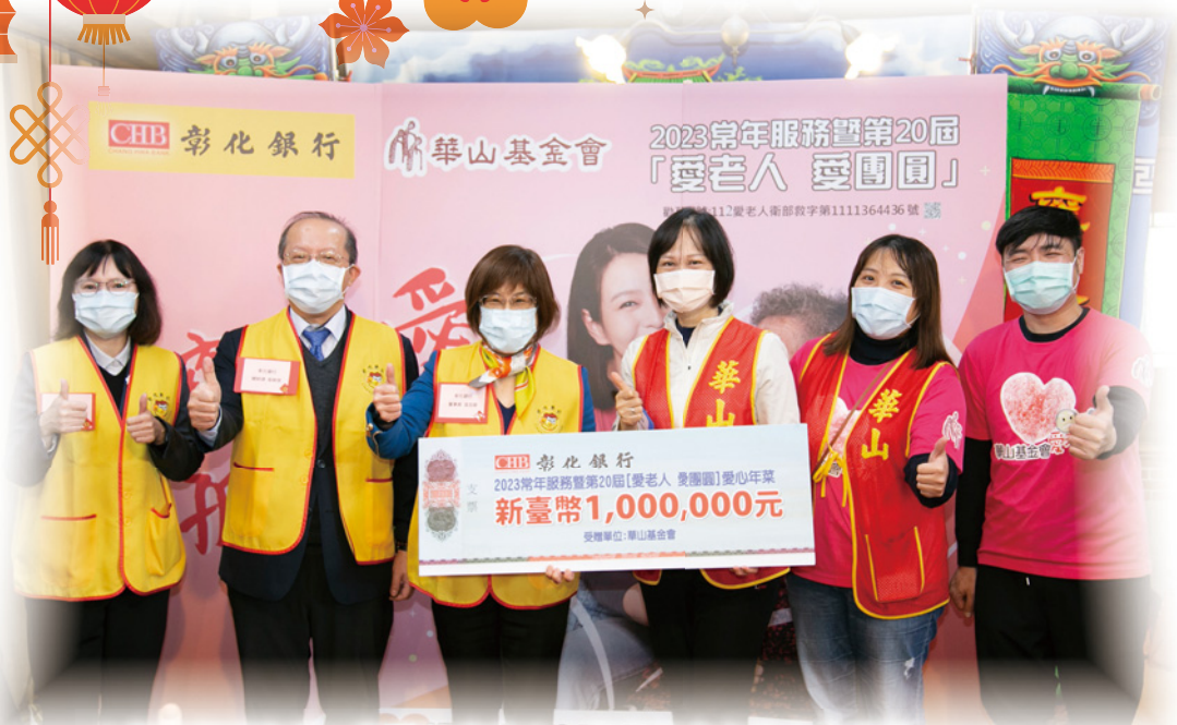
▲彰銀捐贈年菜，期望拋磚引玉，邀請社會大眾共襄盛舉