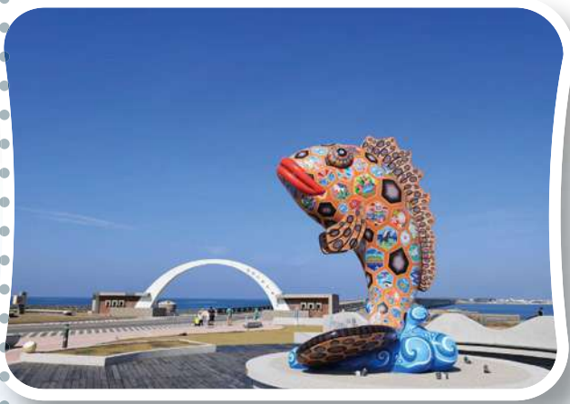
▲跨海大橋前的鯉魚地標

通過大橋前的拱形門，為了不妨礙雙向交通，橋面賽道縮小僅留二人並肩跑道。大橋非常壯觀是西嶼鄉通往馬公的唯一橋樑，於1984年7月開始興建，1996年3月完工取代第一代橋，造價新台幣10億2,800萬元，長度2,494公尺，落成後即為台灣最長橋梁，但自2022年10月30日全長5,400公尺的金門烈嶼大橋通車後，退居為第二長的跨海大橋。此時烈日當空，日曬無遮，少了微風，汗流浹背，精疲力竭，無心欣賞右側的澎湖內海風光。看了手錶，時速降到9分速，一些體力好的選手紛紛超越。跑過大橋中線，見到盡頭的拱門及終點站通樑古榕，隱約聽到大會司儀