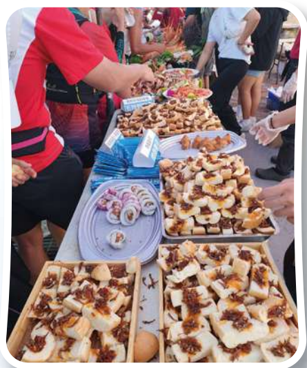
▲美食補給站琳琅滿目

還有軍事雷達。越接近燈塔速度變慢，原來要跑進管制區大門，繞燈塔一圈跑回原路。門前兩側的軍事管制區大門深鎖，有兩位持步槍的武裝衛兵執行門禁勤務。大會人員在僅容兩人通過的門前，用大聲公指引右側單人入，左側單人出，以免阻塞。見到藍天下的白色燈塔分外興奮，我也不免俗拍照留念。進出大門幾乎是走的，人龍排得好長，有一夫當關萬夫莫敵的感覺。來時緩上坡，回程下坡好跑，速度加快，約26分鐘後跑了4公里，回到起跑點，西嶼西臺美食補給站。這次大會響應路跑環保，不提供紙杯裝飲料，而是每人領到大會折疊式矽膠杯，收起來僅一公分高，適合手拿或放入隨身包非常環保便利。第一個補給站當然要讓選手驚喜，著名的龍蝦沙拉痛風餐，搭配鮮炸土魷魚酥、小管、豆乳雞、大蛤包飯、滷豆干、日式壽司、三明治、蘿蔔糕、草仔粿等各式各樣小吃擺滿餐桌，嘴饞的選手擠在龍蝦攤位前開吃。人太擠，我只裝了一杯運動飲料喝完繼續跑。瞄了一下起跑廣場，大會人員正整理將選手衣物送往終點站。