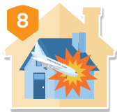
8 航空器及 零配件墜落