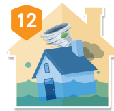
12 住宅颱風及 洪水災害補償