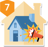
7 民眾騷擾 惡意破壞行為