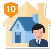
訪客及 第三人責任