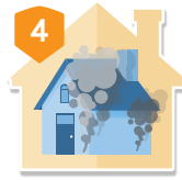
意外事故 所致之煙燻