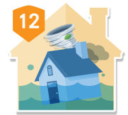
住宅颱風及 洪水災害補償