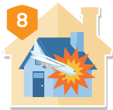
航空器及 零配件墜落