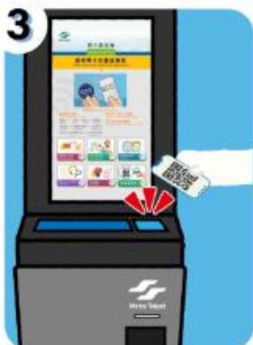
3 開啟手機乘車碼QR CODE畫面 並至QR感應區掃描