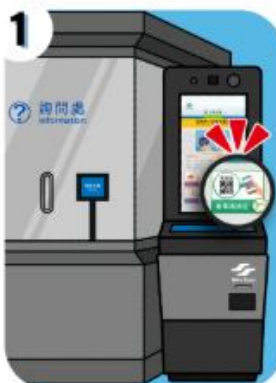
1 至捷運站「票卡查詢機」 點選「乘車碼綁定」