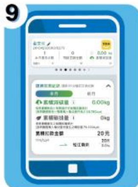
9 APP完成乘車碼綁定 (可至「我的票卡」查看)