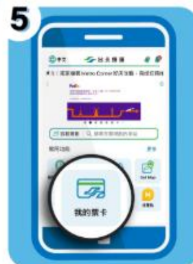
5 手機開啟台北捷運GO APP >「我的票卡」