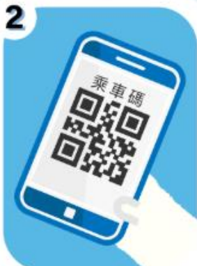
2 手機開啟乘車碼APP 打開乘車碼QR CODE