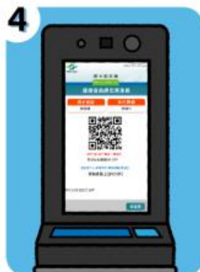
4 完成後，票卡查詢機畫面 將出現綁定乘車碼QR CODE