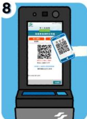
8 手機相機掃描 票卡查詢機畫面之QR CODE